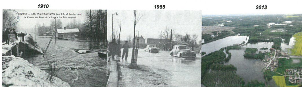
Inondations dans l'Aube

Les principales inondations survenues dans le département de l'Aube sont celles de 1910, 1955, 1983 et 2013. Toute commune traversée par un cours d'eau, quel qu'il soit, peut être sujette à une inondation en cas de précipitations intenses ou exceptionnelles.